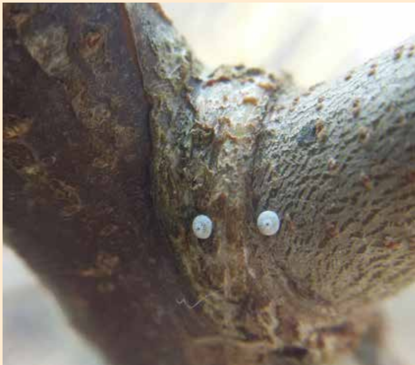
Eitjes in oksel van tak Sleedoorn.