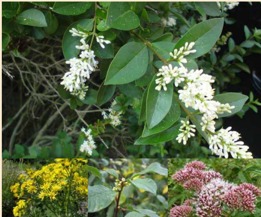
De vlinders besteden relatief veel tijd aan nectar drinken op Braam, Wilde liguster, Vuilboom, Jacobskruid en Koninginnenkruid.